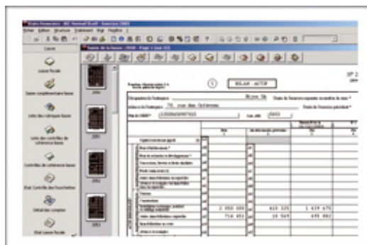
Saisie de la liasse fiscale (en WYSIWYG)